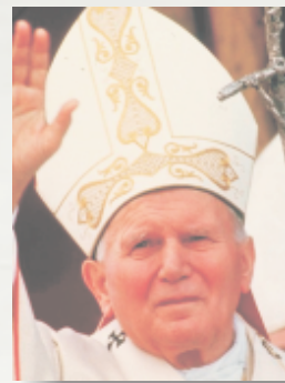
Johannes Paul II