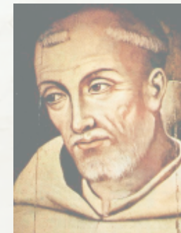
Bernhard von Clairvaux